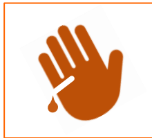
Snijden in hand