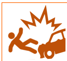
Aanrijden/ Aangereden worden